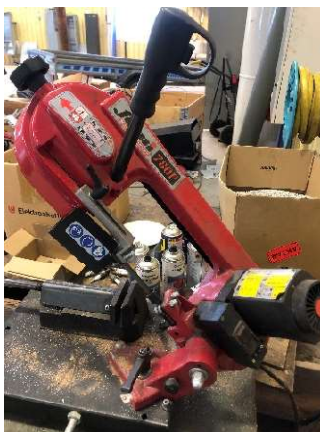
8. Metallbandsåg Femi, 17 kg