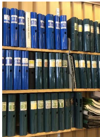
13. Verkstadshandböcker, äldre