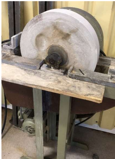
19. Slipsten med golvstativ