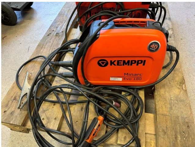
28. TIG-svets Kemppi Minarc EVO 180