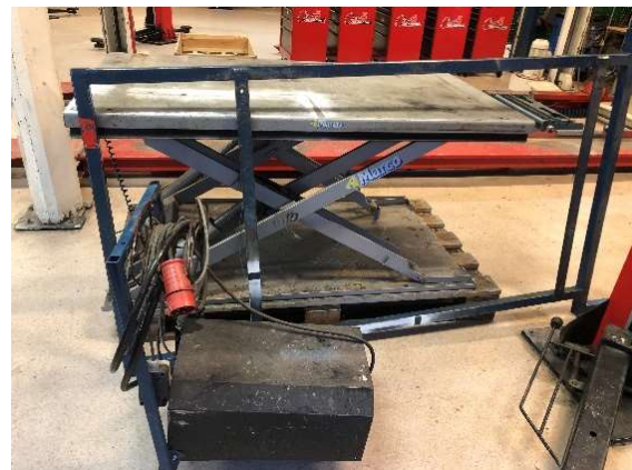
21. Lyftbord Marco med hydraulpump och ram i fyrkantjärn för ex. lyft av snöskoter