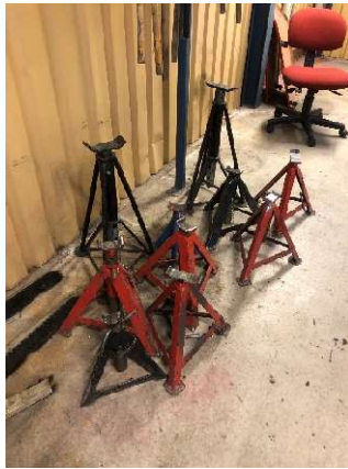
16. Pallbockar 5 st röda i bild