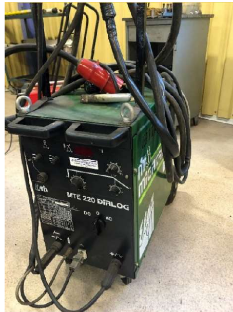
27. TIG-svets Elga Migatronic 220 Dialog