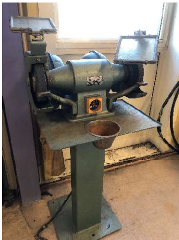
18. Pelarslipmaskin Arboga EP 308