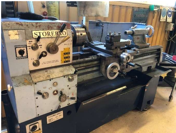
10. Svarv Storebro GK-195 inkl. verktyg