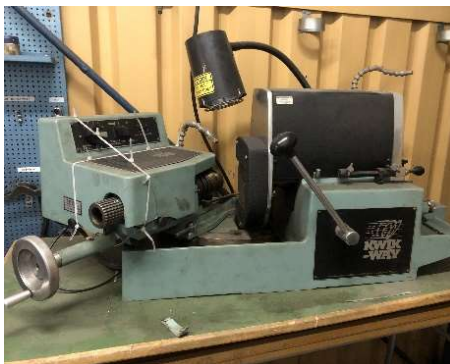
12. Ventilslipmaskin Kwik-Way SVS