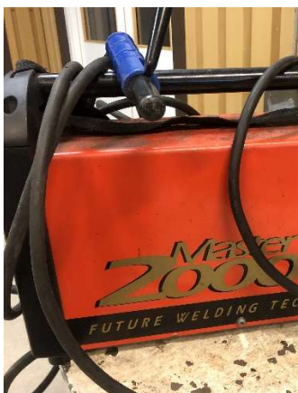
7. Svets Kempfi Master 2000