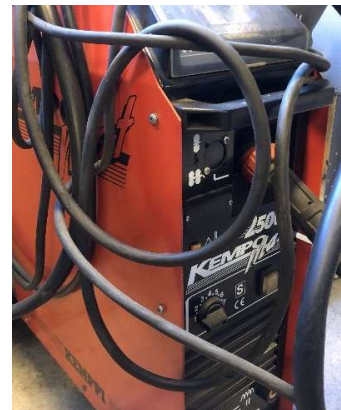
6. MIGsvets Kempomat 2500