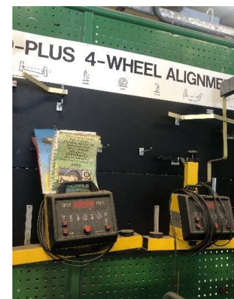
14. Hjulinställning Optoplus