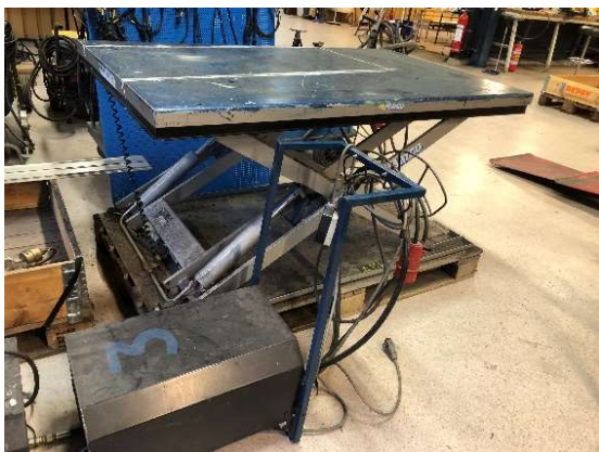
20. Lyftbord Marco med hydraulpump