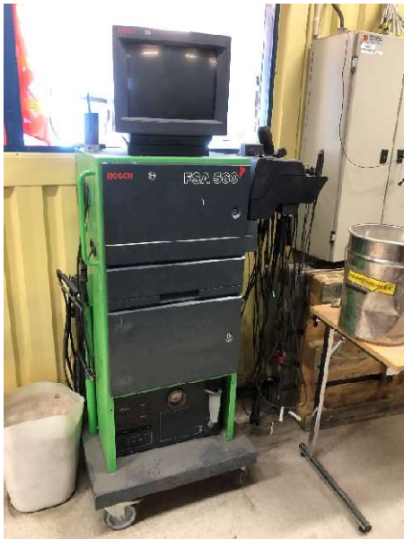
24. Bildagnostik Bosch FSA 560 + kablar Programvara ej komplett, skivor saknas