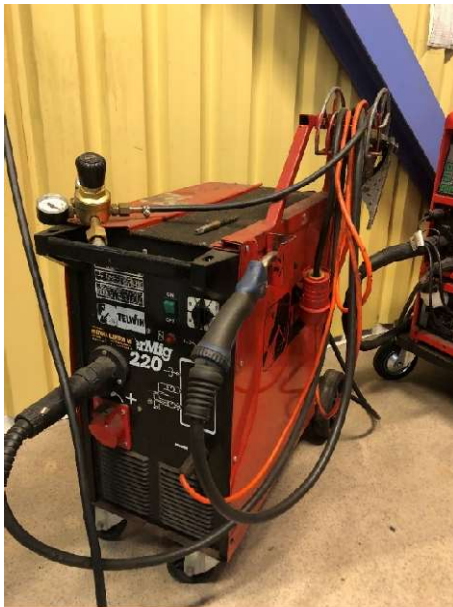
26. MIG-svets Telwin MasterMig 220