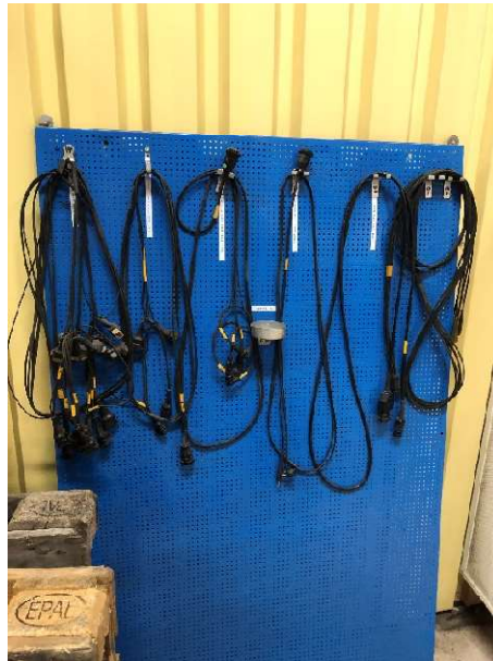
24. Kablar till bildagnostik Bosch FSA 560