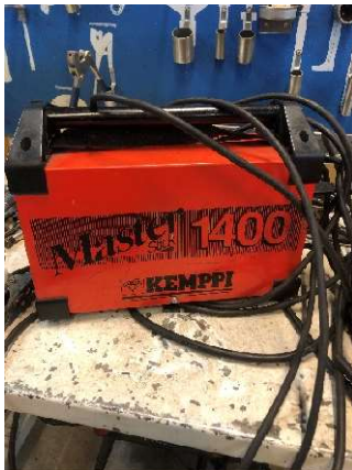
5. Svets Kempfi Master 1400