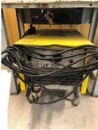
1. Svets ESAB LHF 250