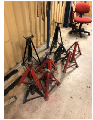
17. Pallbockar 5 st svarta/blå