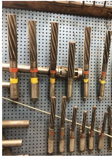
9. Fräsverktyg (ingår)