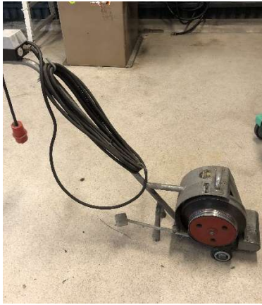
15. Hjultspinnare Columbus