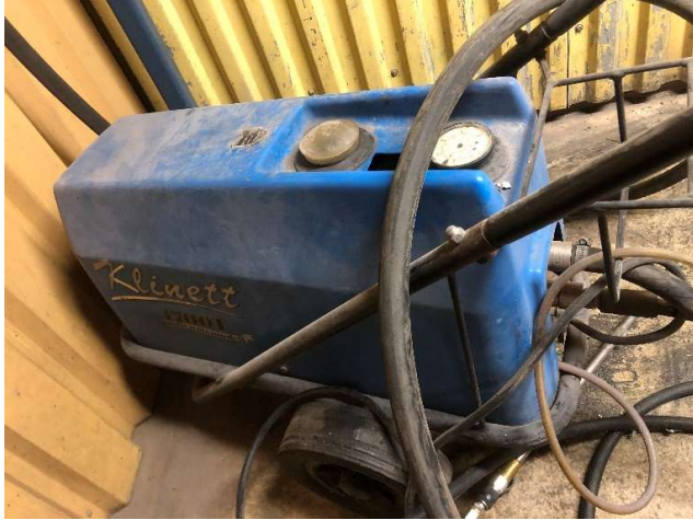
22. Högtryckstvätt Klinett 1700 T