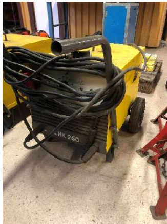
2. Svets ESAB LHK 250