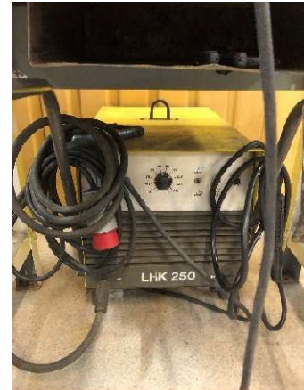
3. Svets ESAB LHK 250