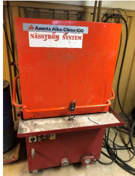
23. Smådelstvätt Alka-Clean 100