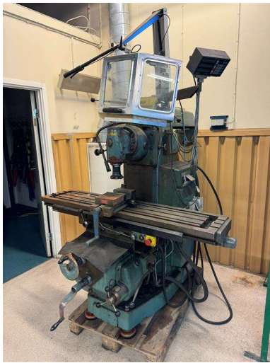
9. Fräsmaskin Sajo UF-54 + verktyg