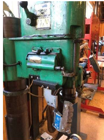
11. Pelarborr Arboga F-135 på golvstativ