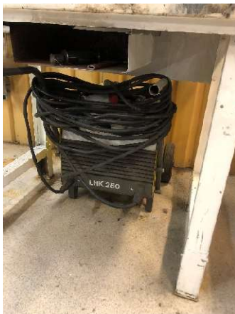
4. Svets ESAB LHK 250